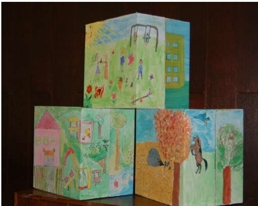
Anketne kutije oslikane dječjom rukom pozivaju na suradnju