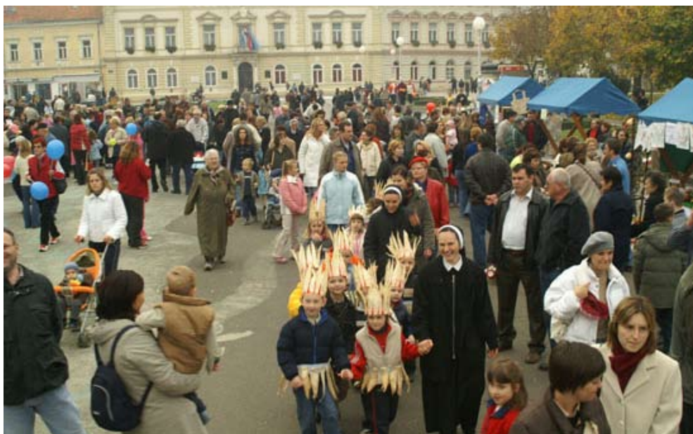
Najveća vrijednost Koprivnice su stanovnici koji vole svoj Grad

Djelovanje i rezultate gradske uprave Grada Koprivnice u postizanju zadanih ciljeva najlakše je prikazati prema Aalborškim obvezama održivih gradova prema kojima ona djeluje.