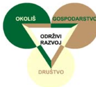
Ilustracija 1: Ključne sastavnice održivog razvoja

(Svjetska komisija za okoliš i razvoj, dokument „Naša zajednička budućnost“, poznat kao izvještaj gđe. Brundtland)