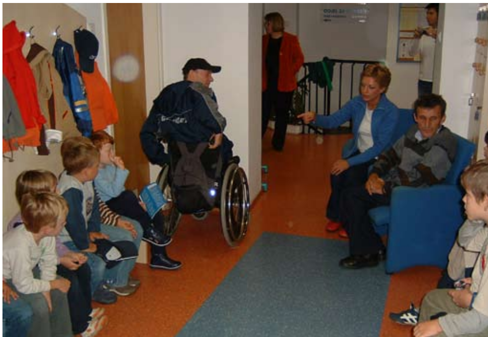
Edukacija o posebnim potrebama osoba s invaliditetom provodi se sustavno