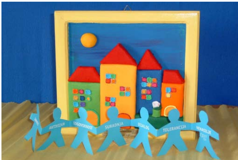
Suradnja lokalne uprave i udruga civilnog društva koristi cijelaj zajednici

u gospodarstvu pogoršava izuzetno loša prometna infrastruktura kao i još uvijek neriješeni problemi odlaganja otpada i nedovoljno racionalno korištenje energije u gospodarstvu.