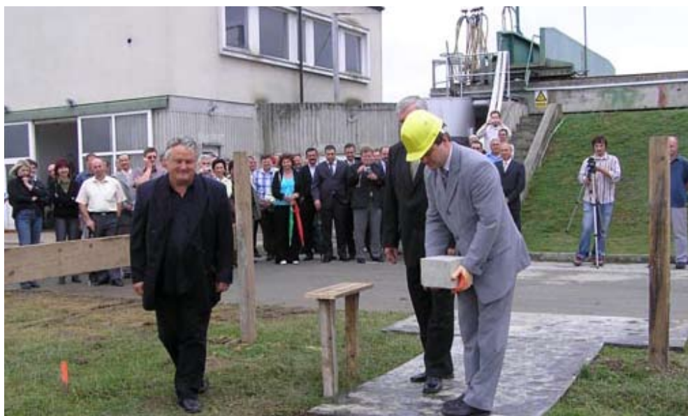
Postavljanje kamena temeljca za koprivnički pročištač otpadnih voda

Uz snažan socijalni program, Koprivnica proširuje mogućnosti školovanja djece, mladih i odraslih, potiče rad i kreativnost mladih i njihovo sudjelovanje u odlučivanju i društvenom životu grada. Intenzivno se vodi briga o sigurnosti kretanja i života te sustavno rješavaju problemi stanovanja.