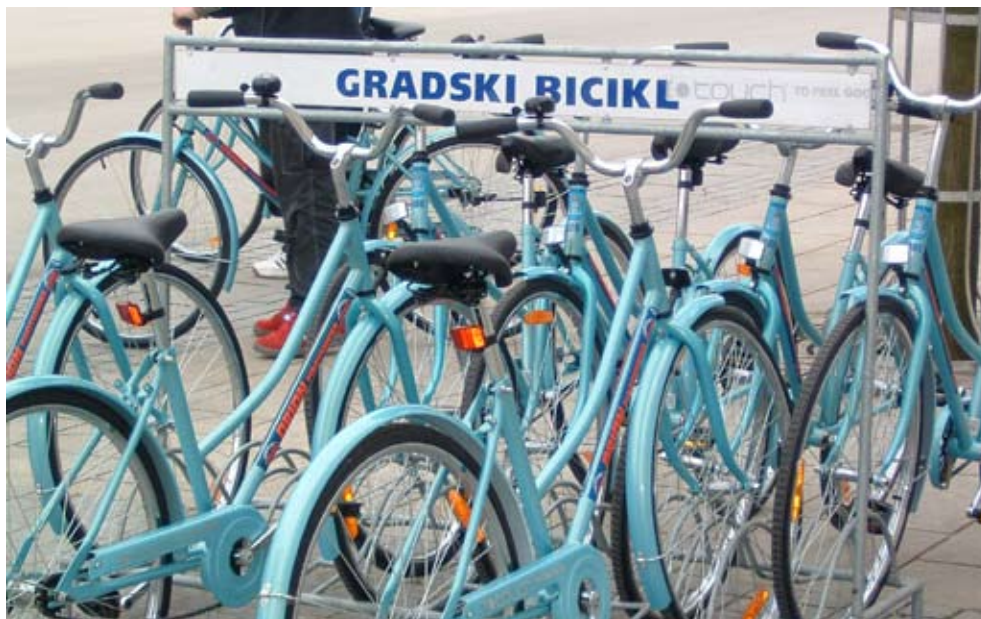
Promocija održivog gradskog prometa s naglaskom na bicikl