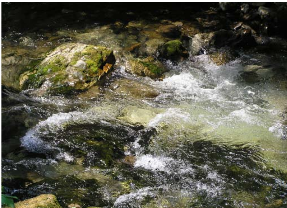
Voda je nezamjenjivi izvor života za sve stanovnike Zemlje

Naš je današnji način života, pogotovo u zapadnom svijetu, NEODRŽIV!