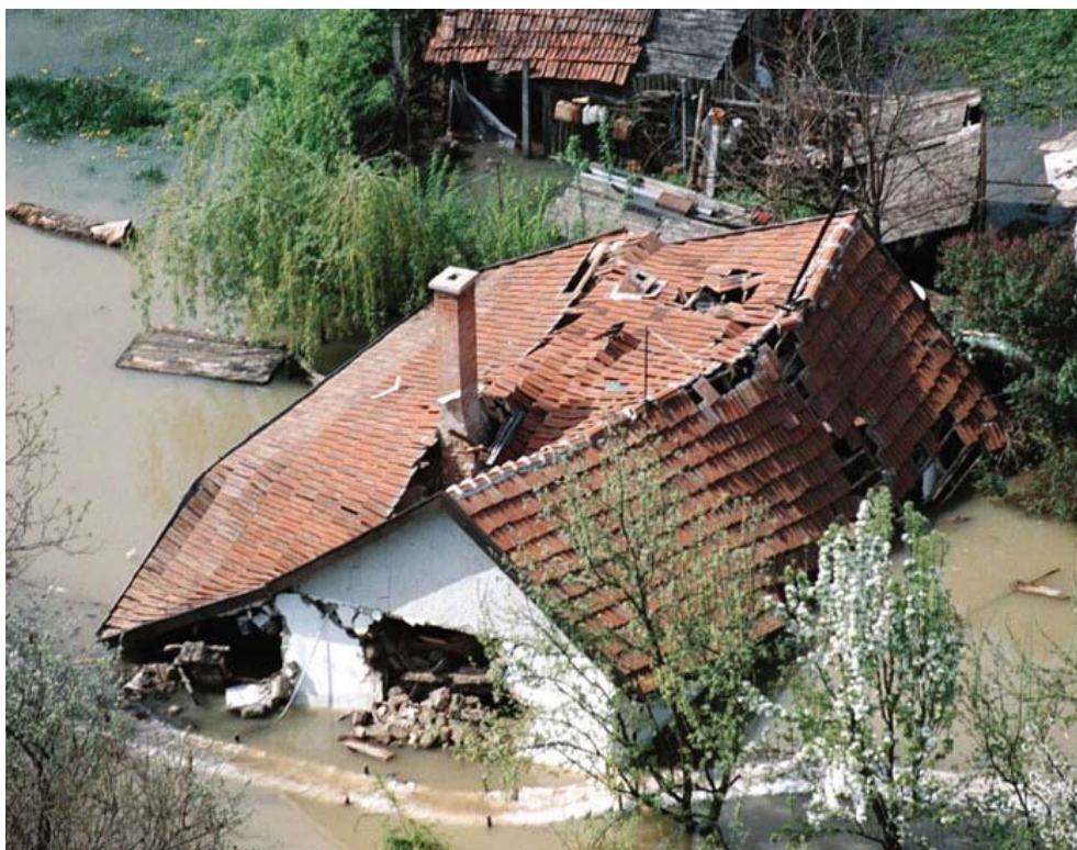
Učestale poplave su jedna od posljedica klimatskih promjena

Izgaranjem fosilnih goriva (ugljen, nafta, prirodni plin) u zrak odlazi plinoviti ugljični dioksid - CO 2 , u količini puno većoj nego što ga biljke i oceani, najveći prirodni „gutači“ CO 2 mogu ukloniti. Ovo uzrokuje „učinak staklenika“, tj. podebljava sloj CO 2 koji okružuje Zemlju uzrokujući tako globalno zatopljenje i klimatske promjene. Osim toga, zbog milijardi tona