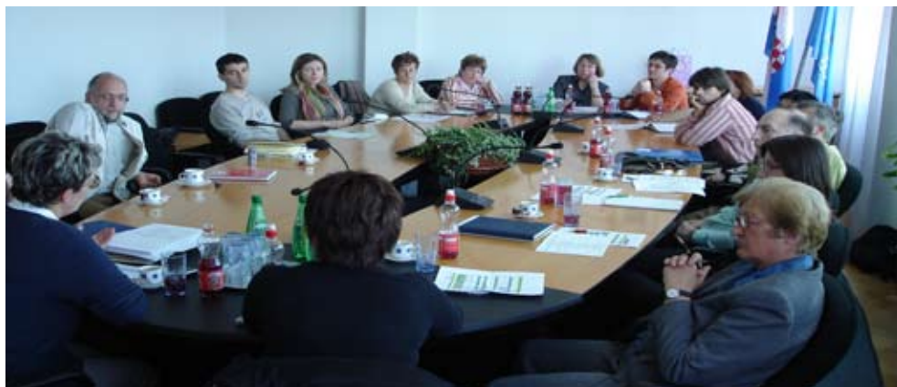
Radne skupine LA21 KC

U ljeto 2005. Gradsko je vijeće imenovalo i Upravni odbor za Lokalnu Agendu 21 i postupak izrade time je i formalno započeo. Prvi korak Odbora za izradu Lokalne Agende 21 bilo je upoznavanje javnosti s ciljevima i koracima izrade dokumenta. Na uvodnom seminaru, koji je izazvao veliko zanimanje i želju za sudjelovanjem, nastao je Forum za okoliš: brojno tijelo zainteresiranih građana - članova udruga, zaposlenika gradske uprave, gospodarstvenika i stručnjaka različitih profila koji su izrazili spremnost da svojim aktivnim doprinosom i znanjem sudjeluju u izradi dokumenta. Iz Forumu za okoliš formirane su radne skupine za okoliš, gospodarstvo i društvena pitanja koje su preuzele praktični dio posla. Skupine broje od 10 do 15 članova - predstavnika gospodarstva, socijalnih, zdravstvenih, kulturnih i obrazovnih ustanova, mjesnih odbora, udruga i gradske uprave.