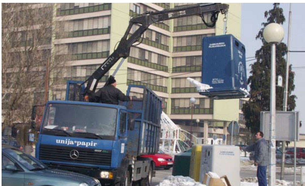
Razvrstavanje na tzv. "zelenim otocima" pridonosi smanjenju količine i problema otpada

Unazad pet godina uvodi se štedljiva rasvjeta - unatoč znatno povećanom broju rasvjetnih mjesta i više od petnaest novih kilometara rasvjete, cijena struje ostala je ista, što svjedoči