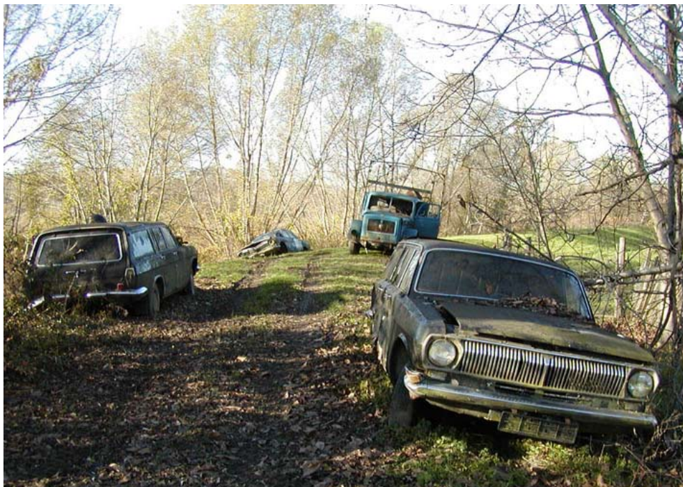
Automobilski otpad sadrži opasne tvari koje izravno ugrožavaju zdravlje ljudi i okoliša